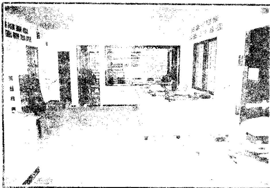
Een deel van het moderne interieur van het gebouw, aan de Anton-drachtenweg No. 20, waarin het Instituut voor Islamitische Studies en Publicaties is ondergebracht. Dit IVTSHIP-GEBOUW werd op 15 febr. 1978 in gebruik genomen.