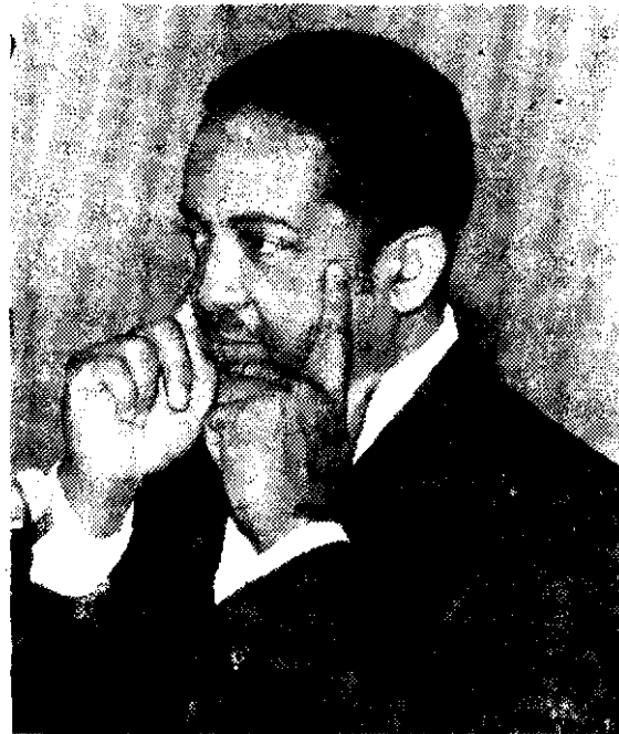
The Honorable W.D. Muhammad

De Vice-President van de Anjuman bedankte de Chief Minister Wallace D. Muhammad voor zijn boodschap aan de in Londen gehouden convention in het afgelopen jaar, waarbij hij zich verzekerde van alle mogelijke medewerking van deze Anjuman om gezamenlijk een programma uit te dragen m.b.t. het propageren van de Islam, hetgeen ook het hoofddoel is van deze Anjuman, overeenkomstig de ware missie van Hazrat Mirza Ghulam Ahmad