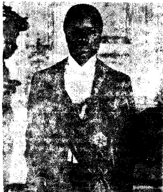
President of Gabon.

uit: The Journal of Muslim World League Mecca, apr.1976 No.6