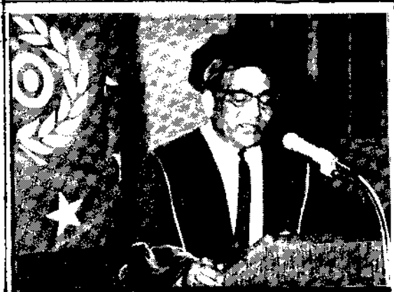
.....tijdens het uitspreken van de inaugurele rede...

Aan het einde van de deze hogelijk gewaardeerde rede, vond een receptie plaats in "Ons Huis", waarbij gelegenheid bestond de Professor en zijn familie te feliciteren.