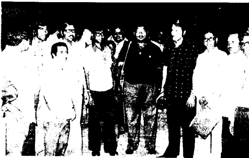
FOTO REPORTAGE VAN DE TE PARAMARIBO GEHOUDEN 6e AHMADIYYA CONVENTION (Verzorgd door: A. Ghafoerkhan)