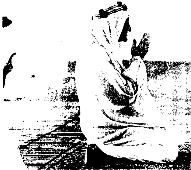
Koning Feisal in zijn privé moskee.

Dit jaar zal Saoedie-Arabië uit de olie een deviezenoverschot van rond 13 miljard gulden overhouden. Ongeveer het zelfde bedrag ligt op Saoedi-Arabische bankrekeningen in Europa en de VS. Over dit geld kan Feisal naar eigen goeddunken beschikken. Zo heeft hij voor het grootste deel de bewapening van het Egyptische leger betaald en de materiële verliezen van de oorlog