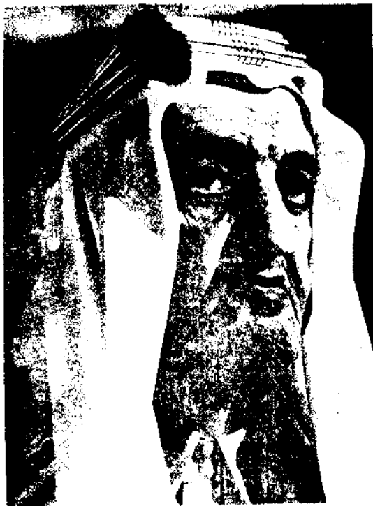
KONING FEISAL.... gezicht getekend door maagkwaal..

(Schatrijk, maar sober, streng en zeer religieus)